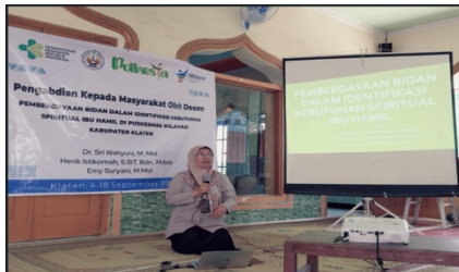
Gambar 1. Foto Kegiatan Penyuluhan Kebutuhan Spiritual Ibu Hamil Bagi Bidan

Berdasarkan gambar 2 dapat diketahui, skor pada pretest minimal pada skor 32 yaitu sebanyak 1 (6,7%) dan mayoritas pada skor 35 dan 36 yaitu masing – masing sebanyak 6 (40%), serta skor 36 merupakan skor tertinggi pada pretest . Skor posttest mengalami peningkatan, minimal pada skor 34 yaitu sebanyak 1 (6,7%) dan mayoritas pada skor 39 yang merupakan skor maksimal perolehan yaitu sebanyak 6 (40%).